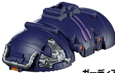
ガーディアンローリング...1